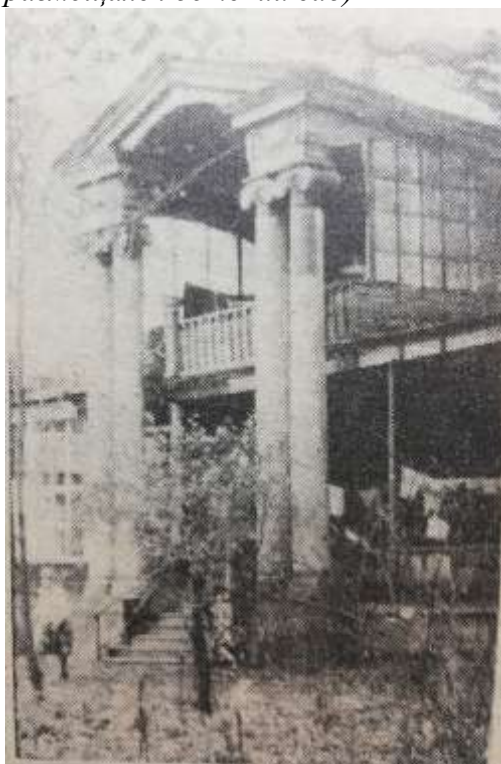
дом по ул.Железнодорожная, д.29 (до революции принадлежал купцу Михайлову; в первые годы после победы Октября здесь находился дом отдыха для деятелей культуры)