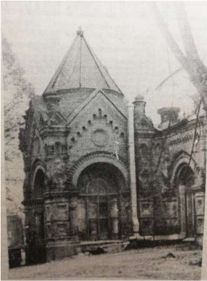
Мытищинская водокачка (фонд 126, оп.1, ед.хр.121)