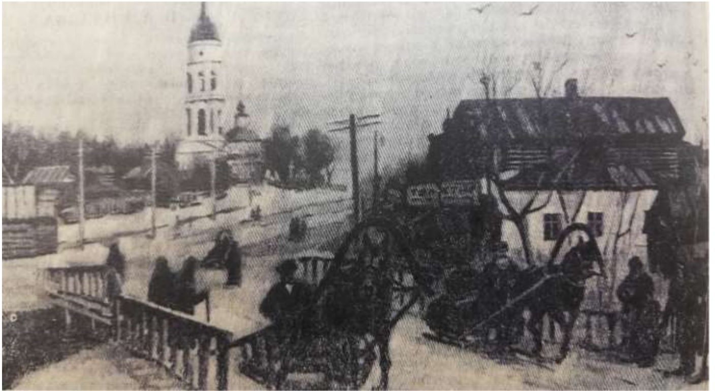
на снимке: фрагмент картины С.С.Королева "Село Большие Мытищи" (фонд 126, оп.1, ед.хр.39, л.68об)

В середине XIX века предшественник города - село Большие Мытищи состояло из 49 дворов. В нем находились Тайнинский приказ, ведавший селами царского двора, почтовая станция и Шоссейный дом, где с проезжих собирались в государственную казну деньги за пользование дорогой.