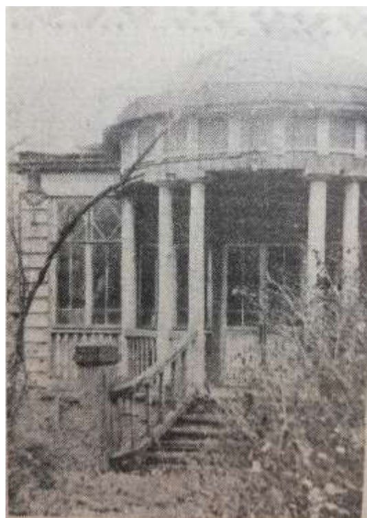
вход на дачу, построенную в 1878-79гг. купцом Перловым