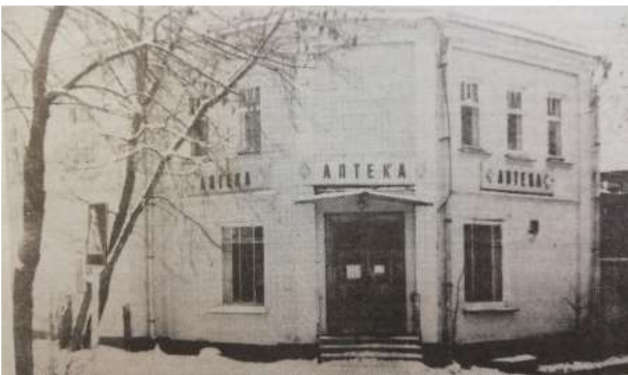
Мытищинская городская аптека №1 на ул.Колонцова, д.33 (фонд 126, оп.1, ед.хр.121)