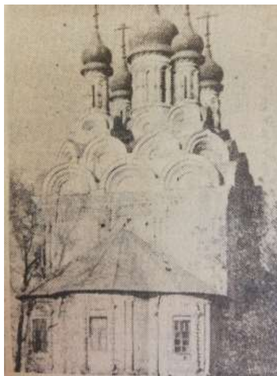
Тайнинская церковь (является шедевром архитектурного строительства второй половины XVII века)