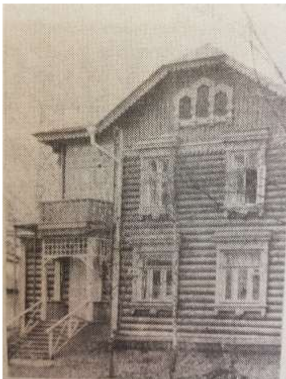
здание по ул.Пионерская, д.10, где в 80-х годах размещался детский сад)